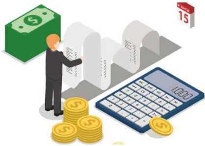
PRESUPUESTO (Consejo directivo)