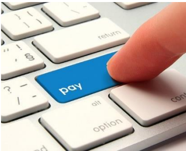
PAGO ELECTRÓNICO (Tesorería y Rectoría)