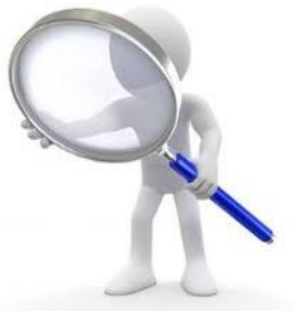
SUPERVISIÓN (Líder #WAP)