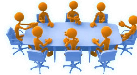
SELECCIÓN (Comité evaluador de propuestas)