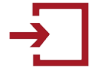
Sistema Electrónico de Contratación Pública