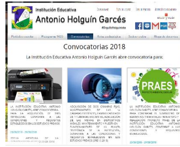
CONVOCATORIA (Estudios previos y publicación: Tesorería y Rectoría)